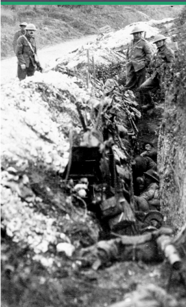
Tranchée St. John's Road, 1916